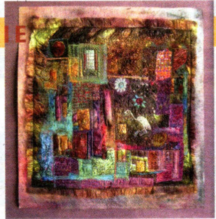
SASKIA WEISHUT-SNAPPER 'PEINTISSERIES' - TEXTIELE WANDSCHILDINGEN

De tentoonstelling wordt geopend op zondag 8 januari om 16.00 uur door Bonne ten Kate, photographer/sculptor