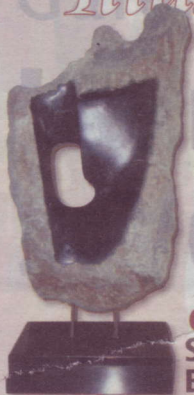
GON BELLO STENEN BEELDEN