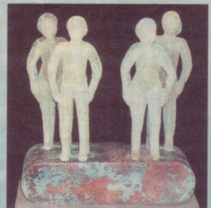
JOEK VAN DRAANEN BEELDEN MET GLAS EN BRONS

Galerie Kunst 2001 Dorpshuis Snelliuslaan 35 Badhoevedorp