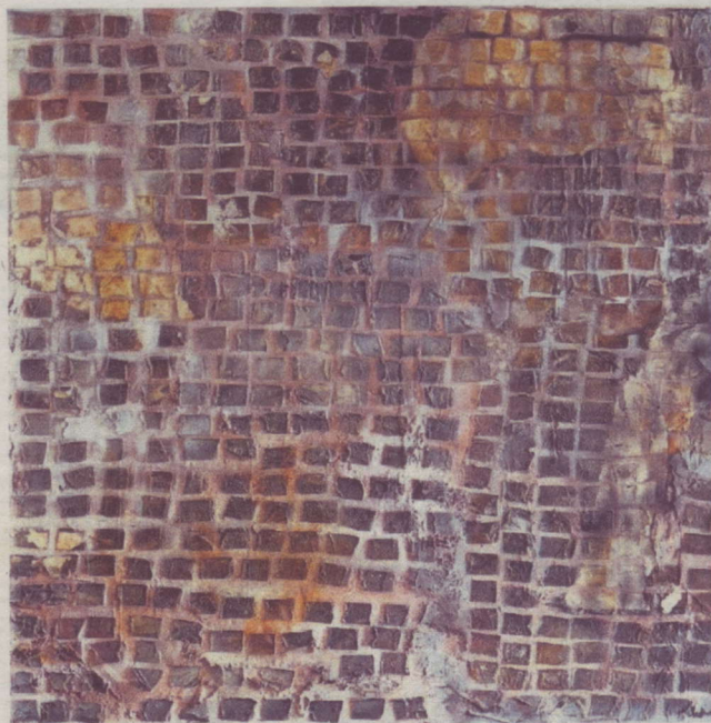
Het werk van Van Esschoten ontstaat uit een samenspel van kleuren en materialen.

Galerie Kunst 2001, Dorps- huis Badhoevedorp, Snellius- laan 35, telefoonnummer: 020-6596693, e-mail info@galeriekunst2001.nl Openingstijden vrijdag, zater- dag en zondag van 13.00- 17.00 uur. Daarbuiten alleen op afspraak. www.galeriekunst2001.nl facebook.com/Kunst2001