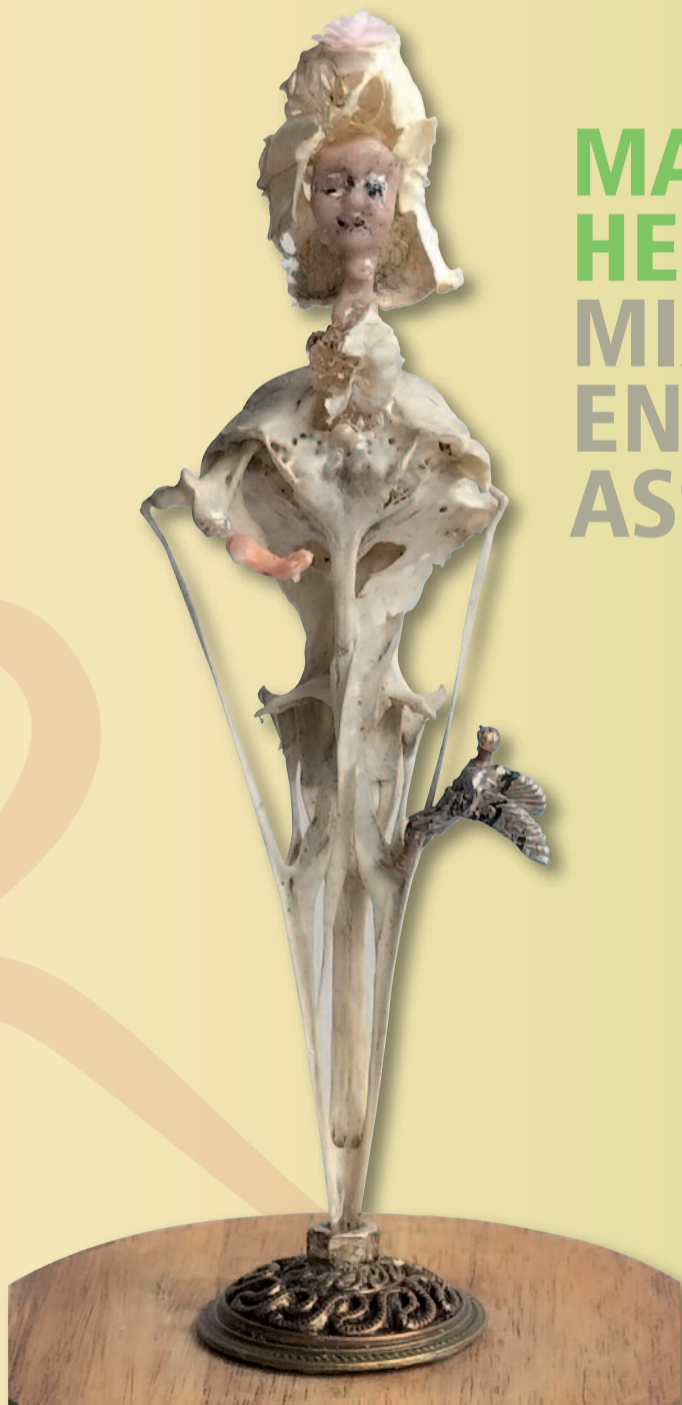
MARIJKE HESSELS MIXED MEDIA EN ASSEMBLAGES