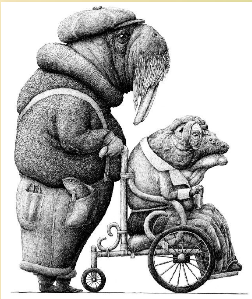
REDMER HOEKSTRA PENTEKENINGEN

Van vrijdag 6 september t/m zondag 13 oktober 2024 De tentoonstelling wordt geopend op zondag 8 september om 16.00 uur