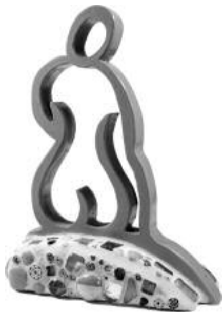
Persoonlijke ervaringen en gevoelens universeel maken, vreugde delen, het leven vieren, kunst uit hart en ziel maken, dat is haar doel.

Haar visie op de wereld is geïnspireerd door mooie momenten, gratie en vreugde, een visie die zij wil delen met de toeschouwer.