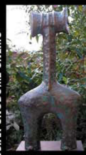
JOSIAH ONODOME ONEMU