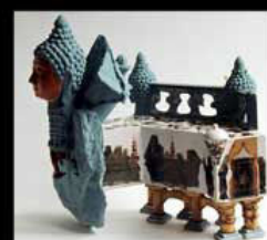
DANIËL LEVI ISRAËL