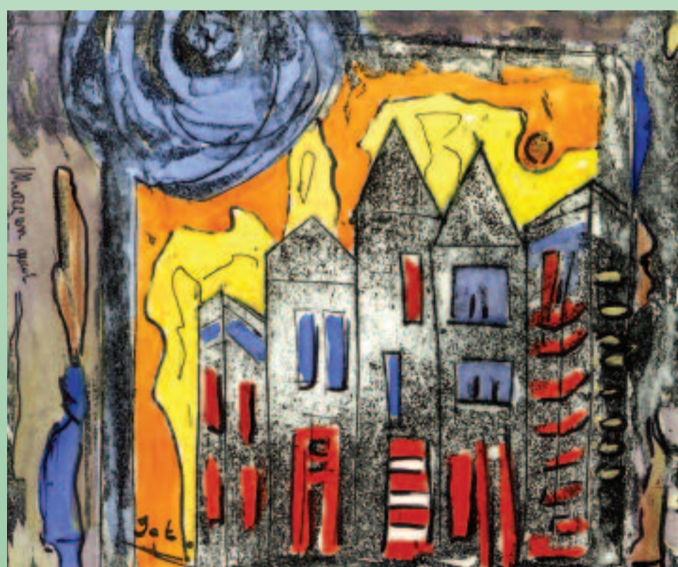
IET RAMMERS- DE KORT ETSEN ZEEFDrukKEN SCHILDERIJEN