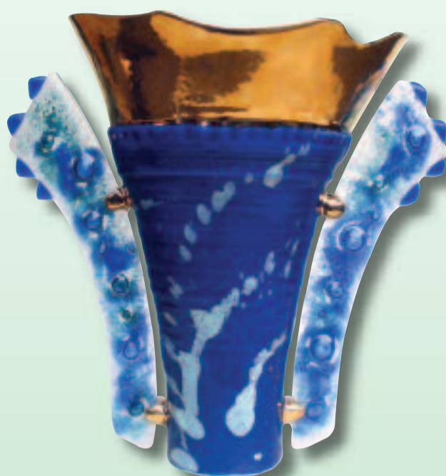
HANS OTTENHOF GLASOBJECTEN