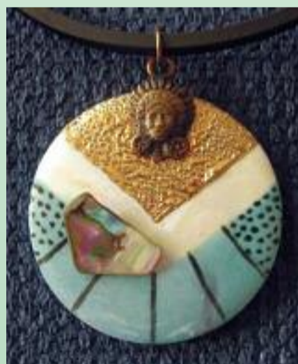
DINY TOOM SIERADEN VAN BESCHILDERD PORSELEIN