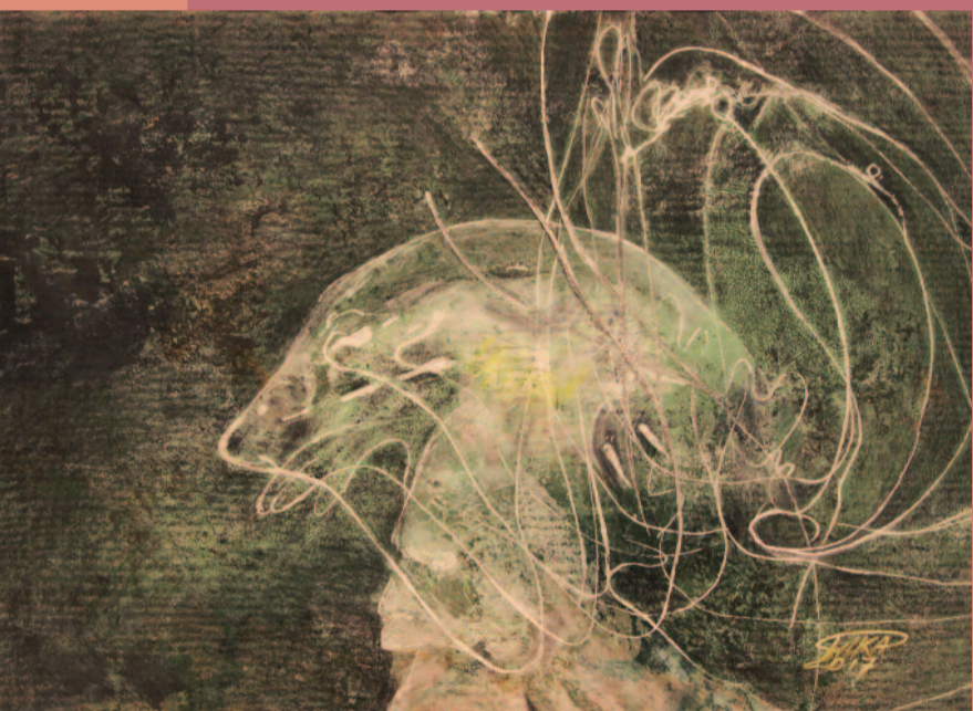
MIKA STAM-VAN VONDEREN SCHILDERIJEN