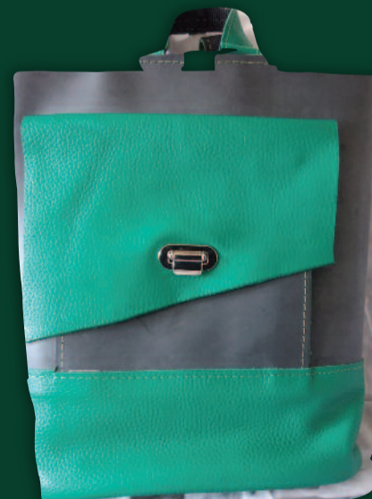
TOOS VAN DISHOECK TASSEN

Galerie Kunst 2001 Dorpshuis Snelliuslaan 35 1171 CZ Badhoevedorp