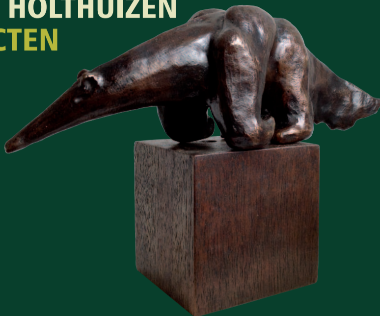
TEUN VAN VEEN KLEINE BRONZEN