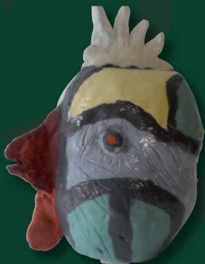
PETER VAN HORSSSEN KERAMIEK FANTASIEËN