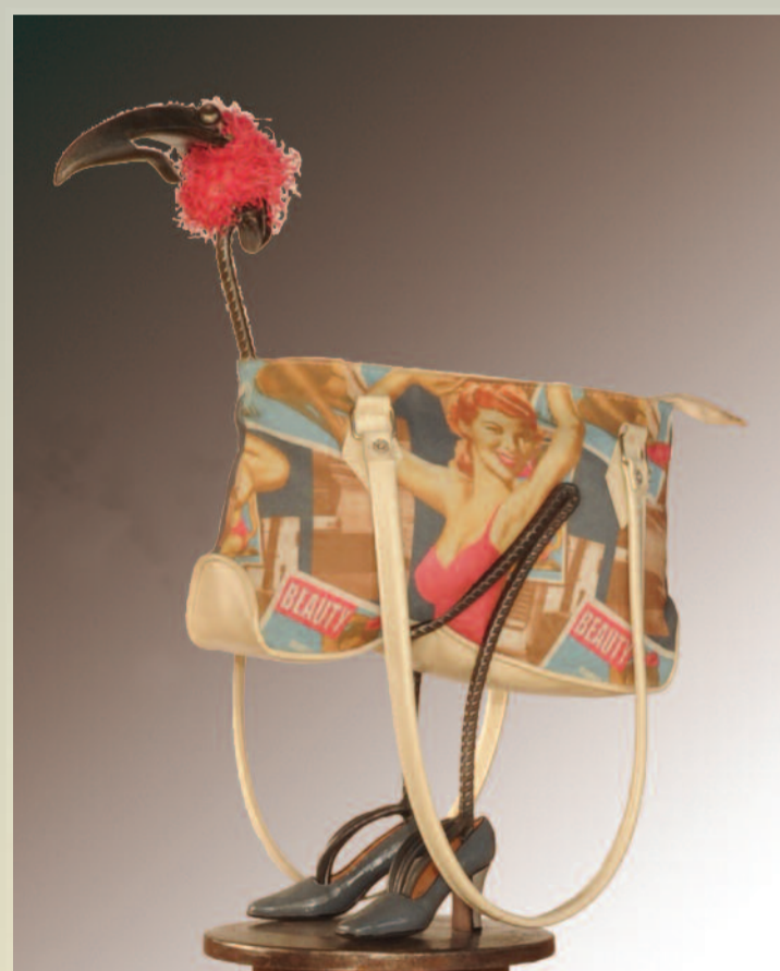
GEORG WITTWER OBJECTEN IN GEMENGDE TECHNIEK