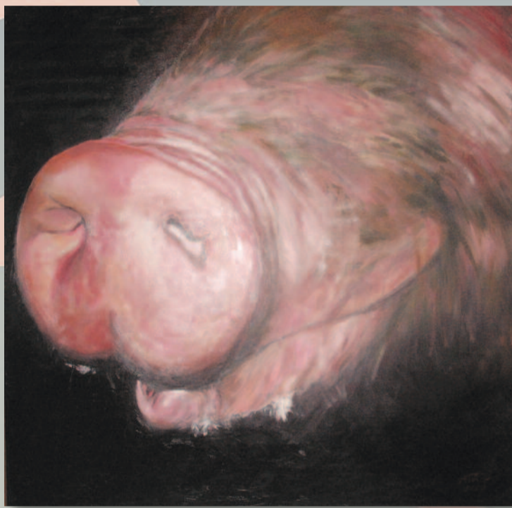
MIKA STAM - VAN VONDEREN SCHILDERIJEN