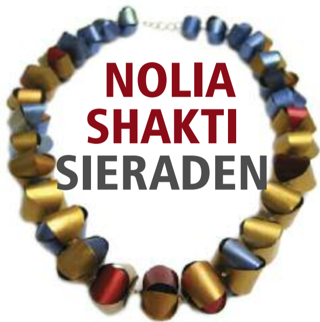
NOLIA SHAKTI SIERADEN

De tentoonstelling wordt geopend op zondag 2 september om 16.00 uur