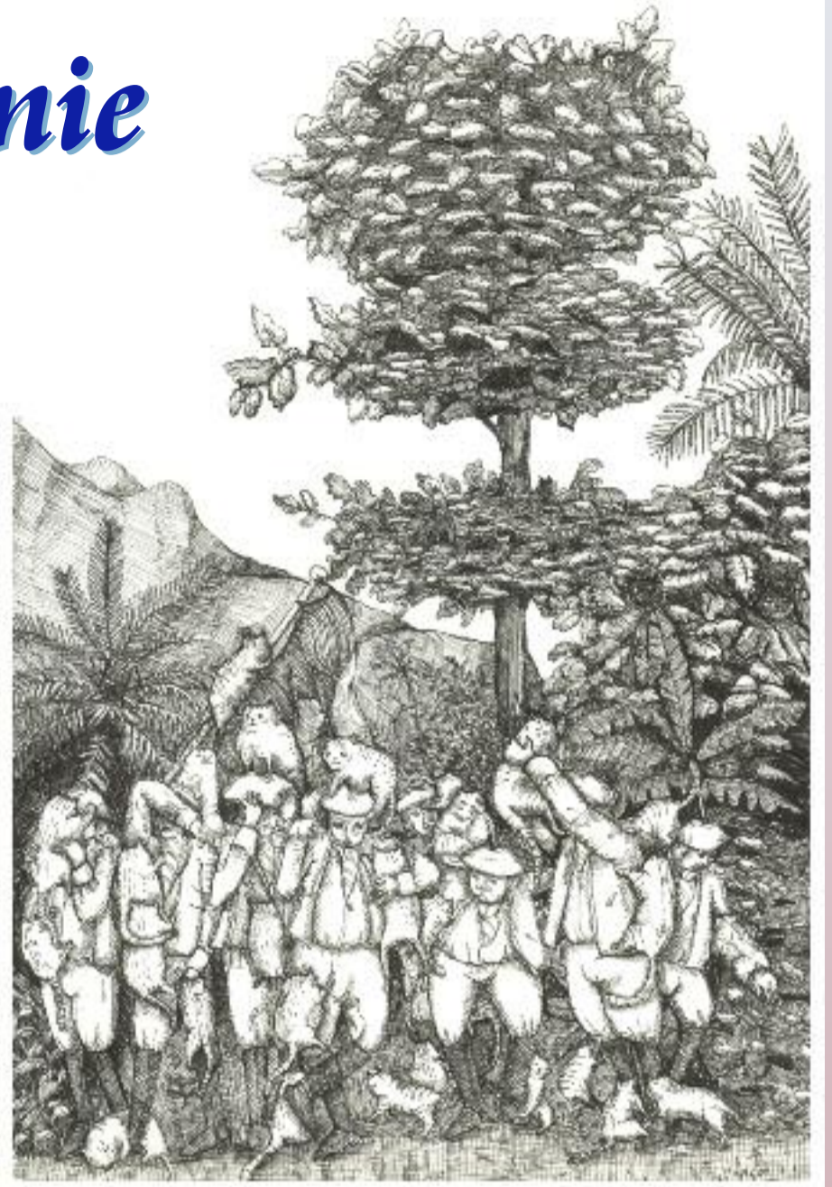
MARGOT HOLTMAN TEKENINGEN